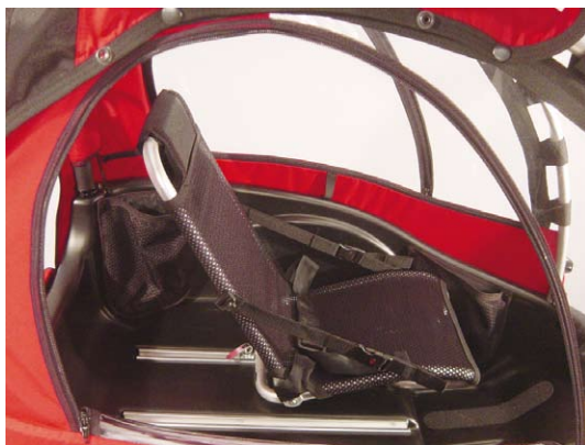
11.3 Kørestilling med sædet placeret fremme giver maksimal bagageplads bag sædet.