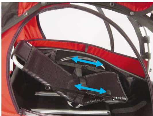
11.4 Hvilestilling. Hvilestilling opnås ved at skyde sædet frem og løsne begge sædeseler.