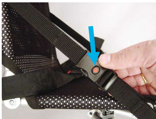
11.5 Sovestilling opnås ved at åbne sædeseler- nes klikspænder ved tryk på den røde sikkerhedsknap.